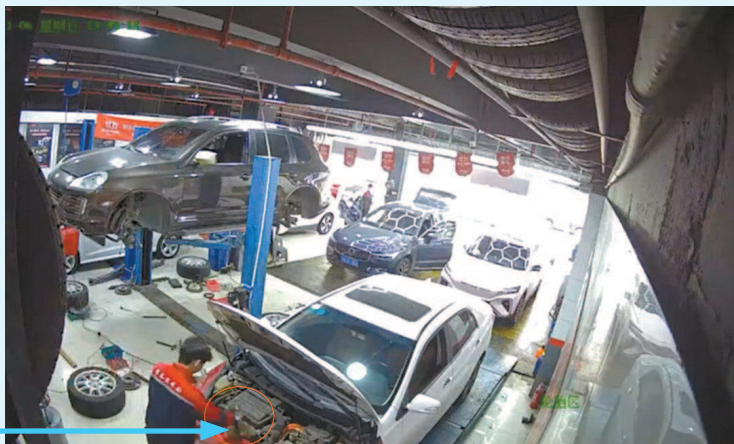
监控拍到工作人员填塞了一块毛巾