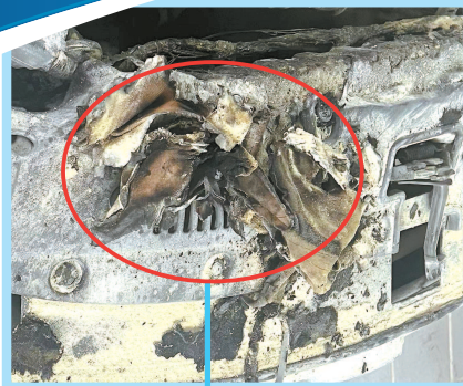
从发动机舱取出一块毛巾