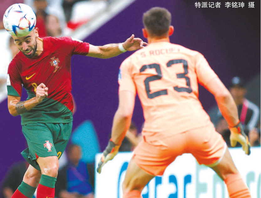
■ “二当家”B费挺身而出

谈及之后的目标时，B费仍然不忘将主角位置归还给“大当家”，“我们全队都希望C罗能捧起大力神杯，我认为他有能力，也配得上这样的荣誉。”捧着本场最佳球员的奖杯，B费不忘强调自己“辅助者”的身份，“我会给C罗更多帮助，希望能帮他分担些压力。”一支在内部没有地位之争的葡萄牙队，值得更多期待。 本报记者 陆玮鑫