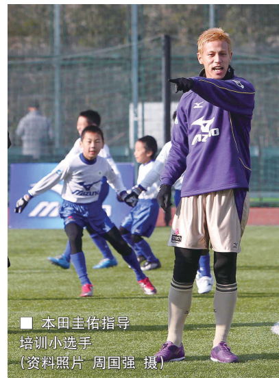
■ 本田圭佑指导 培训小选手

一般情况下,欧美地区的足球评论员在介绍首发阵容时,只会播报球员的姓氏,而韩国队的后防五金,不仅姓氏的读音相同,出现在官方名单上的英文字母排序也完全一样。面对这样的情况,一位意大利解说只能无奈地用“金金金金”这种听上去有些类似五言绝句,又有些绕舌风格的方式,介绍韩国队后防人员的情况,至于具体谁是谁,只能等待比赛开始后,再通过球员号码