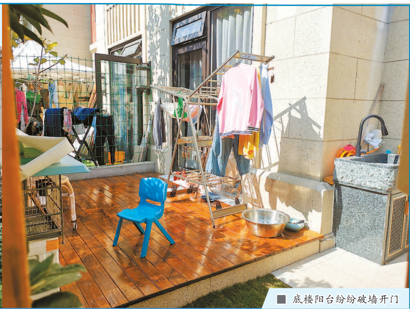
■ 底楼阳台纷纷破墙开门