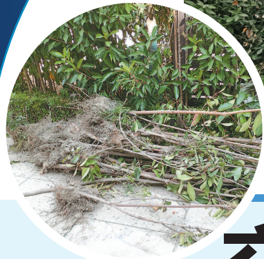
■ 绿植被连根挖出丢弃