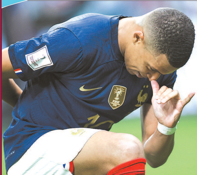
姆巴佩庆祝进球