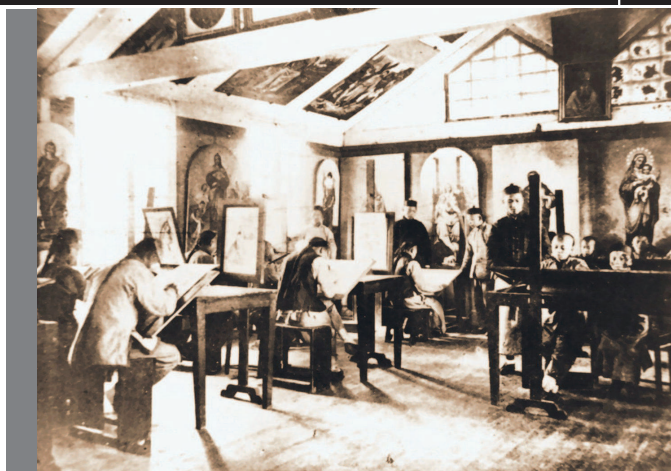
清末土山湾画馆内景