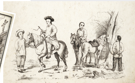
土山湾画馆 1907年编辑出版的《铅笔习画帖》一页