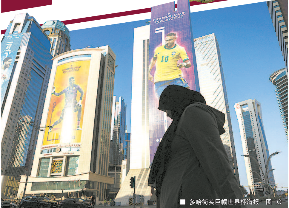
多哈街头巨幅世界杯海报 图 11