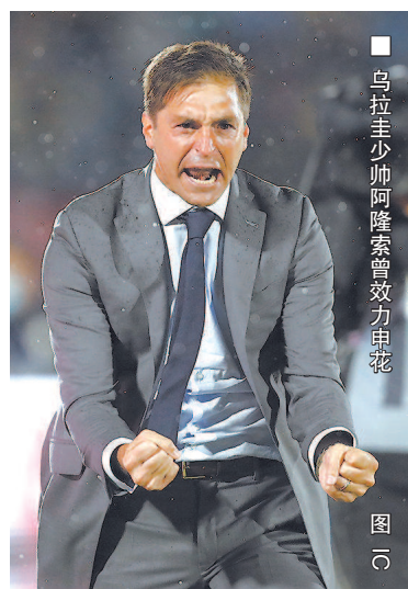
乌拉圭主帅阿隆索曾效力申花 图 10