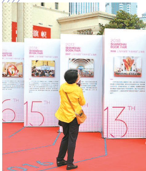
书展历程区吸引人们驻足观看