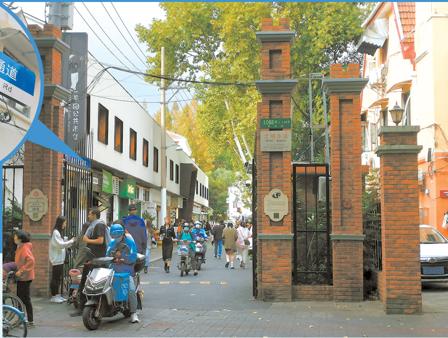
◀ 原先的“宏业花园”门头