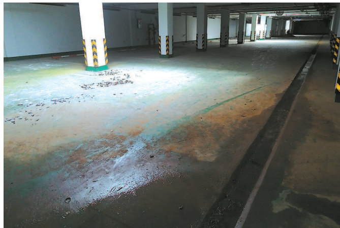
■ 地下车库一直荒废