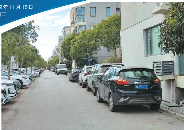
■ 小区里车辆停得满满当当