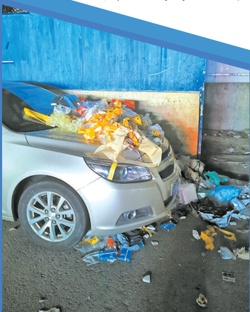
■ 有的业主车只能停在“垃圾房”旁