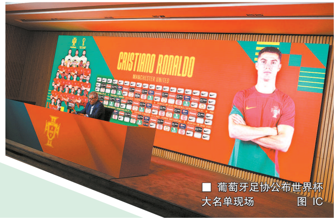
■ 葡萄牙足协公布世界杯大名单现场