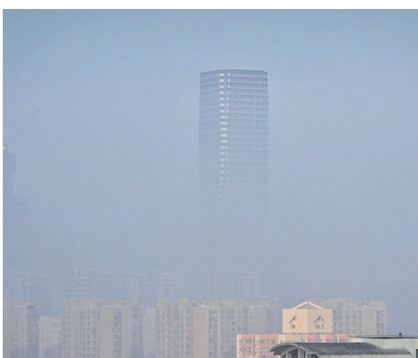
今晨7时40分,摩天大楼的“腰段”消失在晨雾中。上海中心气象台拉响入秋以来首个大雾橙色预警信号

今年冬天是“暖冬”还是更冷呢?近日,中国气象局国家气候中心组织召开全国气候趋势会商会,经分析研判,预计今年冬季,影响我国的冷空气强度总体偏弱,全国大部地区气温接近常年同期或偏高。