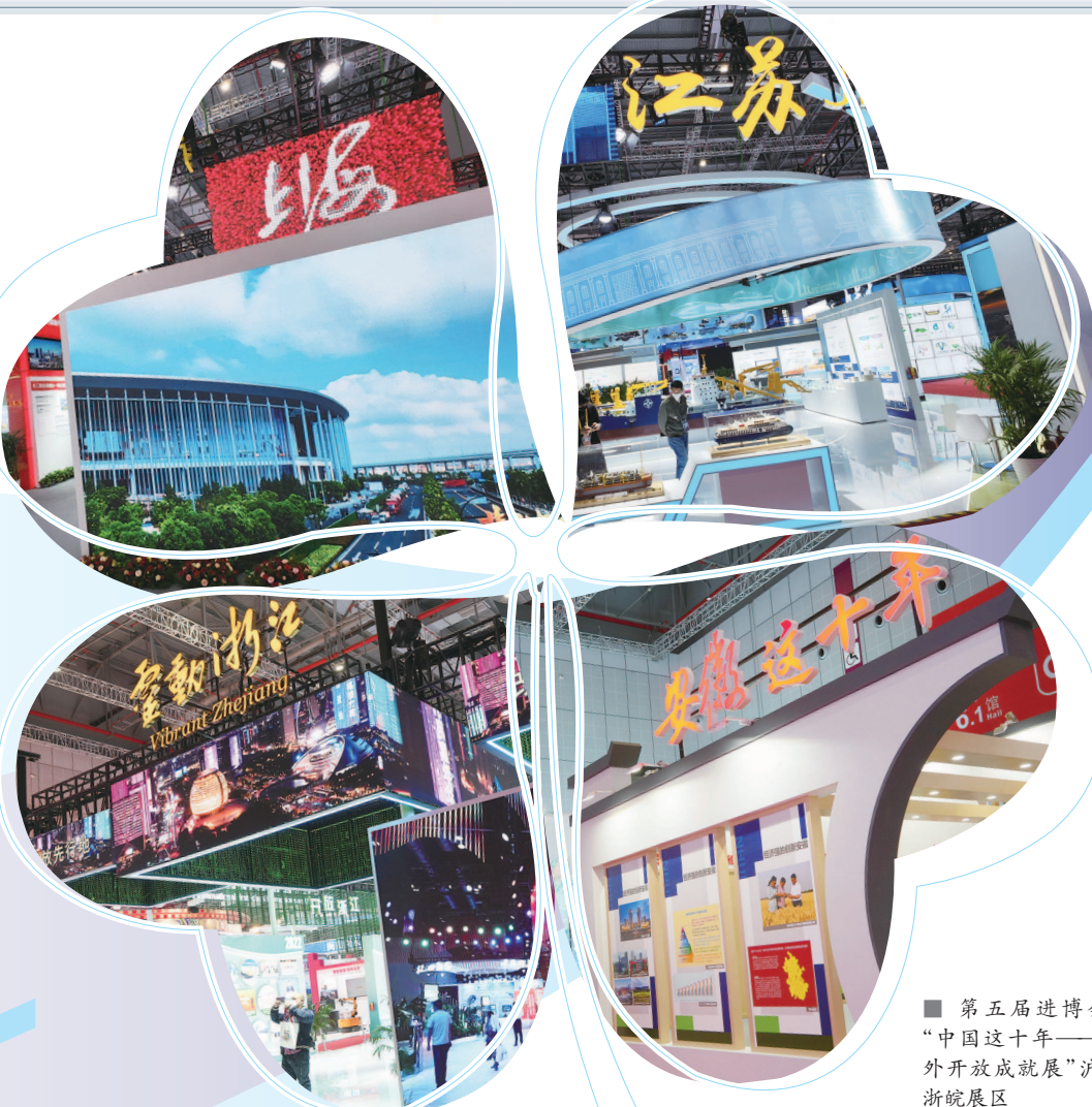
■ 第五届进博会, “中国这十年——对 外开放成就展”沪苏 浙皖展区 本版摄影 记者 刘歆

2018年,正是在首 届进博会开幕式上,长三 角一体化发展正式上升 为国家战略。转眼间,第 五届进博会如约而至。 开放的进博会与开放的 长三角,有哪些故事?不 妨从一双熊猫鞋、一条科 创廊、一叠明信片说起。