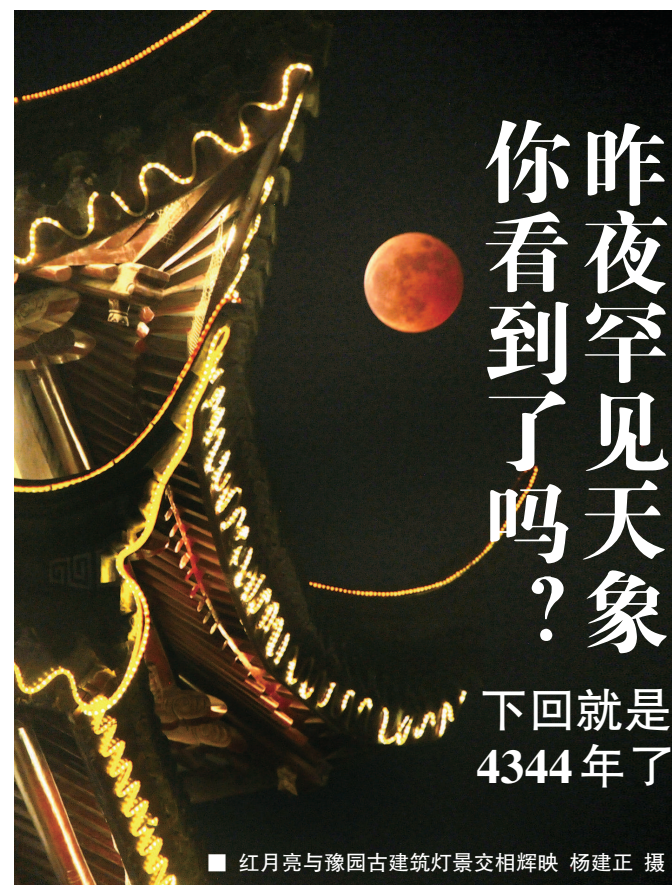
■ 红月亮与豫园古建筑灯景交相辉映

本报讯(记者 邵阳)昨晚的“天空剧场”没有让人失望，“红月亮”掩天王星如期上演，这场抬头可见的年度天文大片也在朋友圈刷屏。