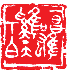
■ 篆刻:雄鸡一唱天下白