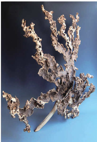
■ 姜饼木根艺作品《嫦娥奔月》

篆刻家似乎都喜自制手拓印谱,邓散木先生如此,叶先生也如是。叶先生常常会去废纸品商店买来廉价的薄光纸,或一般宣纸的零料,制成印谱单页后自行拓印,装订成册后,加以封套赠友。一开始,《遯斋印痕》每页都是用黑色圆珠笔在每个页面上画好长方形的印谱框。后来,是送印刷厂印制印谱框。听篆刻家范振中先生说,他当年也曾陪叶先生去印刷厂印制过。叶先生送我的那一册《遯斋印痕》的印谱框就是印刷厂印制的。