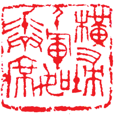
■ 篆刻:横扫千军如卷席