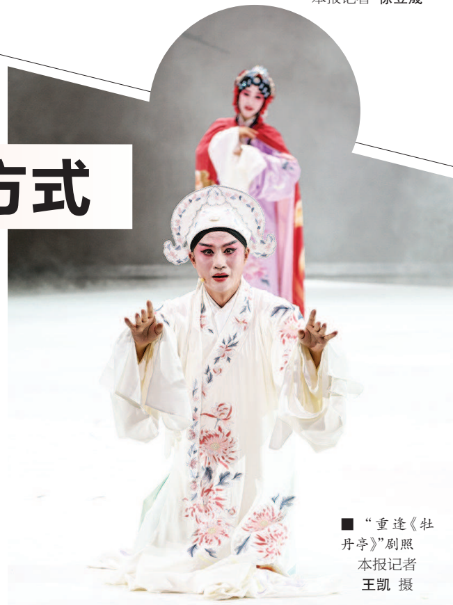
“重逢《牡丹亭》”剧照