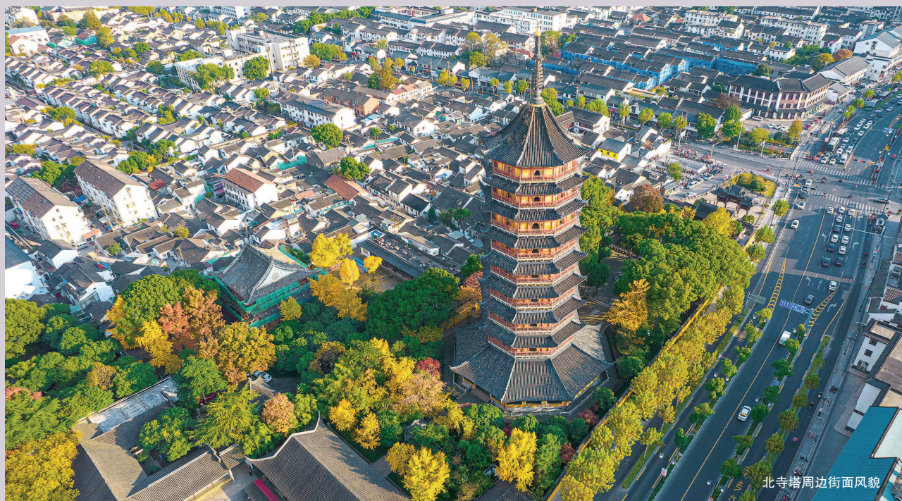
北寺塔周边街面风貌