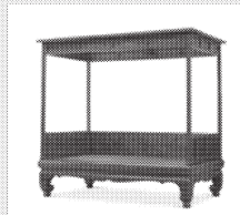
孙克弘制 明万历 黄花梨刻诗文卷松葡萄图 四柱架子床 中贸圣佳2019秋拍 起拍价: 1800万 成交价: 5002.5万