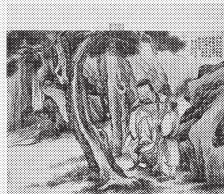
石渠宝笈著录 静寄山庄旧藏 金冠标《听泉图》中贸圣佳2022春拍 起拍价: 2200万 成交价: 3634万

官方网站: www.sungari1995.com 联系电话: +86-130 0109 6628