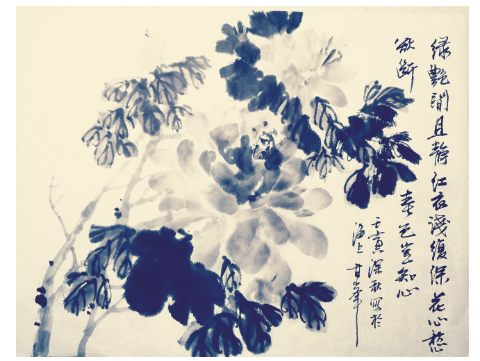
绿艳闲且静 (中国画) 甘峯

两位大爷，一种心态，有时散淡一些，生活便有了情趣。心有田园，则风月自来，脚下便是乐土。