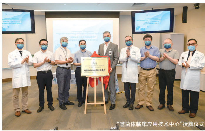
“噬菌体临床应用技术中心”授牌仪式

医生用户群体。作为哈佛大学医学院附属麻省总医院在海外的重要战略合作伙伴,嘉会医疗自2012年起同麻省总医院在院整体规划、运营管理、临床研究、医护培训等诸多领域深入合作。上海嘉会国际医院拥有国家临床试验研究资质和能力,其国际化团队可以和国内外超一流的医疗机构合作,进行各个阶段的临床试验和研究,并同许多国内外领先的生物医药及器械企业开展全面“产学研”合作,主导及参与包括肿瘤、影像、心内等多个领域的临床科研项目,为患者探索更多创