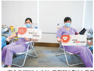
▲嘉会发起“热血守护,重载新生”献血号召