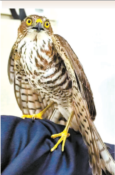
崇明警方10月9日救助的游隼