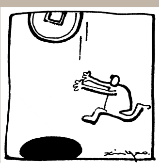
天上掉馅饼,地下有陷阱 郑辛遥作品