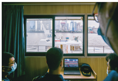
■ 黄浦海事局执法人员收看直播