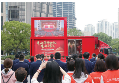
■ 市民游客在一大纪念馆广场收看直播