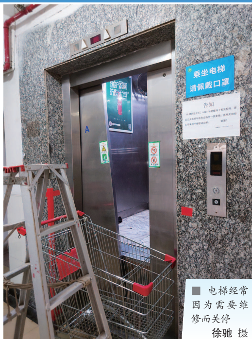
■ 电梯经常因为需要维修而关停

家住静安区大宁路街道延长中路561弄建银曙光小区的多位居民向“新民帮依忙”求助,小区1号楼、2号楼内的4部电梯“服役”26年,已远超15年的正常使用年限。严重老化“带病上岗”之下,夹人、关人、急坠等“惊魂一幕”连连上演。而面对这性命攸关的大事,物业和维保企业却陷入了“反复修复反复坏”的“死循环”。300多户居民为此胆战心惊,急切盼望能早日更换新电梯,真正保障他们的居住安全。