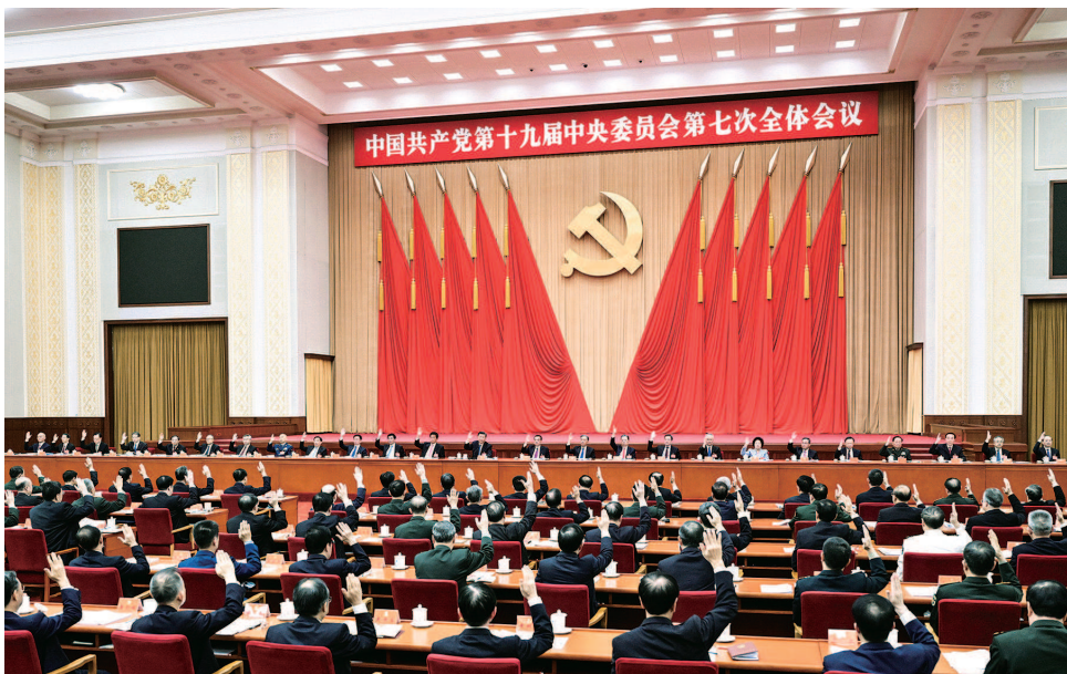
■ 中国共产党第十九届中央委员会第七次全体会议在北京举行,中央政治局主持会议