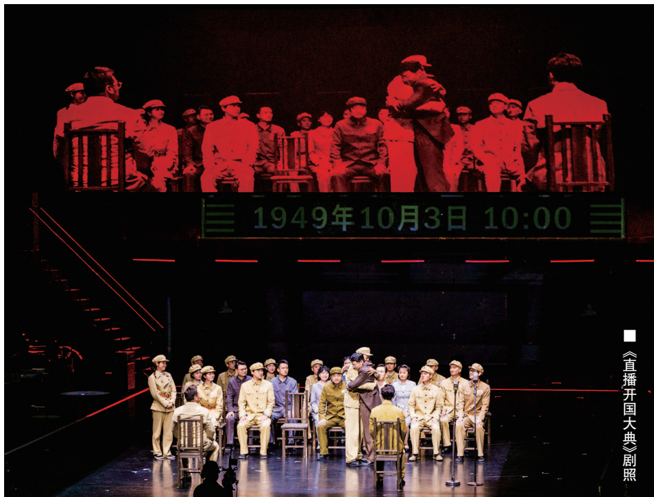
《直播开国大典》剧照