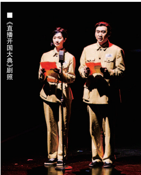
《直播开国大典》剧照