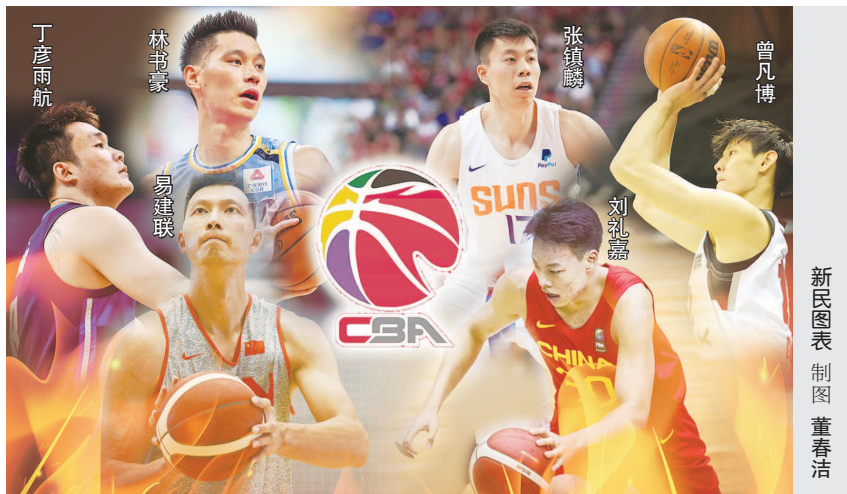
新民图表制图 董春洁

新赛季的CBA28岁了。如同28岁是一个篮球运动员的黄金年龄一样,28岁的CBA也成熟了,就像新赛季的口号一样:当燃由我。新赛季,新人想一飞冲天证明自己,老将老骥伏枥想为自己正名,他们都值得期待。