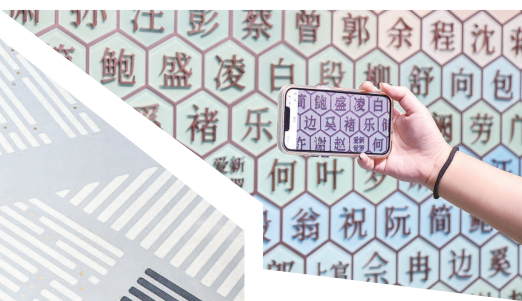
▲ AR多媒体互动姓氏墙 ▶ 读者使用智能书架