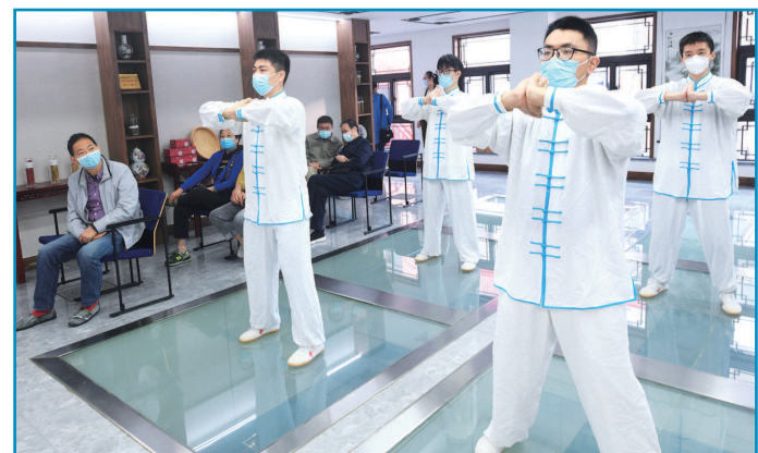
上午,岳阳医院第十八届中医养生节开幕。活动现场,呼吸六字诀中医养生保健操进行了推广演示