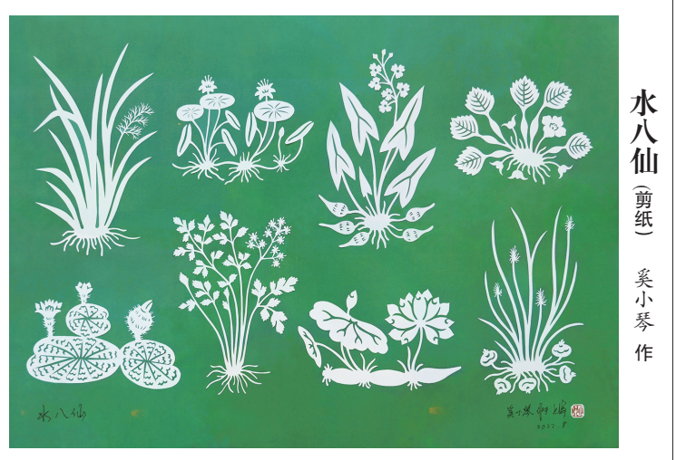
水八仙(剪纸) 奚小琴作

时间都在安详地睡觉,间或醒来,紧紧地握住爱人的手,陈先生则轻轻地回以一句,“小妹,我们马上到家了”,她便笑咪咪地、放心地继续睡了。 9月26日凌晨1点,飞机终于再次顺利起飞,到达浦东机场。周洁夫妇随后进入浦东医院,开始隔离。回国后的第五天,2021年10月1日晚,在祖国的土地上,在爱人的怀抱里,周洁永远地闭上了美丽的双眼。 10月18日,周洁的告别仪式举行,陈先生为妻子撰写了挽联:“舞动天涯影视人间倾国千秋颂;誉满五洲桃李芬芳浩气万年扬”。中国驻美国休斯敦总领馆原总领事李强民与原教育参赞龙杰也专程从北京赶来参加。在致辞中,李强民充满感情地说道:“周洁老师创作和参与创作的一系列舞台形象和银幕形象栩栩如生,在中国人民和北美很多观众的心目中留下了深刻的印象,鼓舞了一大批中国人,为实现民族伟大复兴的事业而努力奋斗。” 此时,身形羸弱却容颜依旧的周洁,静静地躺在鲜花丛中,与最爱她的人们一一告别。她短暂、绚丽的一生,如流星闪耀人间,又如烟花般盛放天空。她是一代上海女性的传奇,又是一个波澜壮阔的时代的缩影。