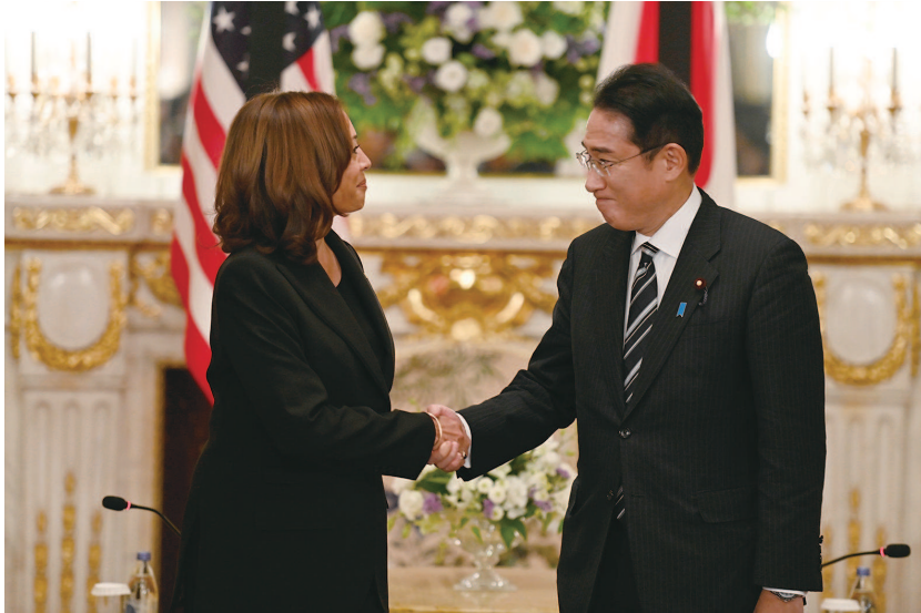
■ 哈里斯与岸田会晤