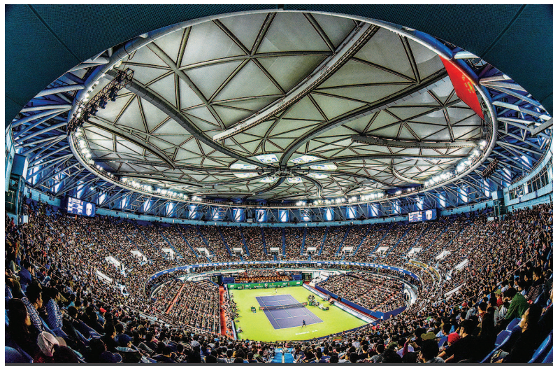
金奖《闵行旗忠网球中心巅峰决战》