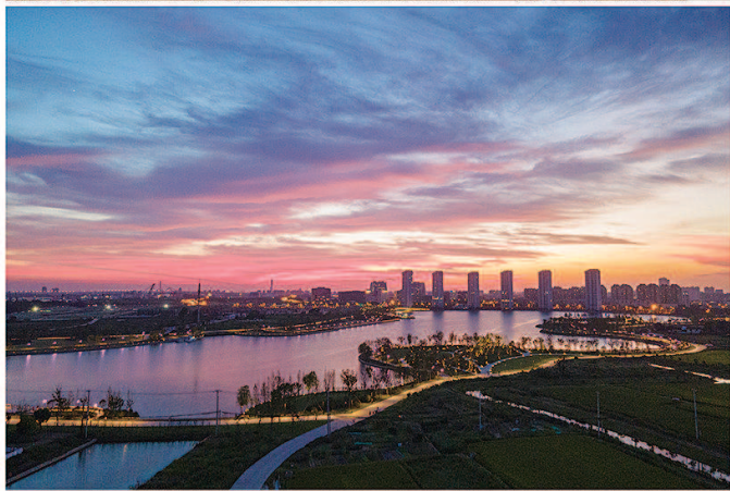
特等奖《绚丽多彩兰香湖》