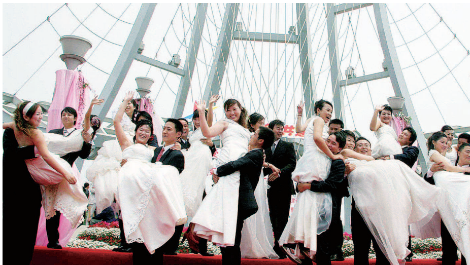
银奖《闵行体育公园集体婚礼》