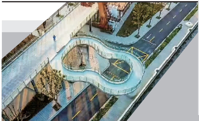
▲宝山区蕴藻浜南岸的“星空高线公园”