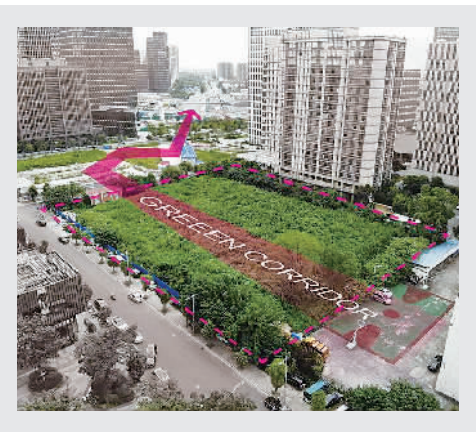
▲杨浦区“大创智绿轴”的设计方案示意图