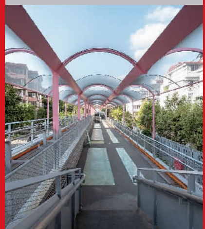
▲百禧公园粉色顶棚的社区艺术长廊