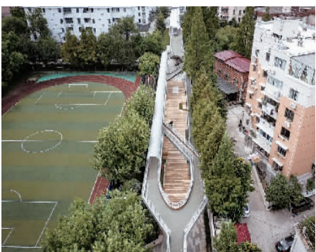
▲百禧公园南段的沙田月台