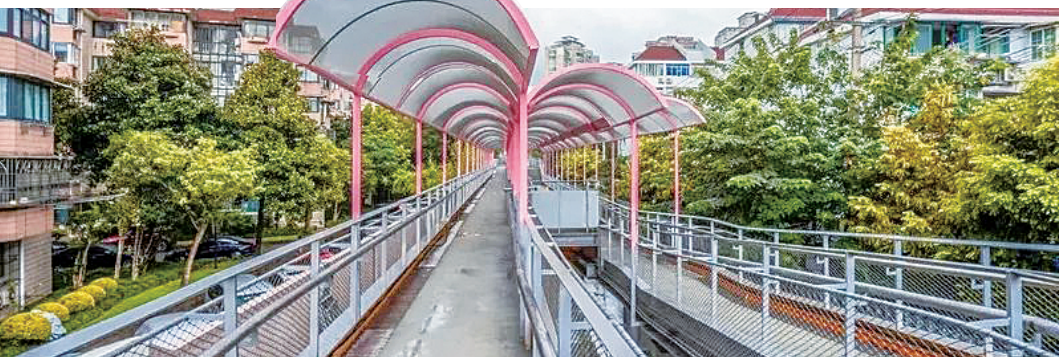
▲位于普陀区的百禧公园内,部分遮阳棚采用了火车站候车棚的造型

在国际设计之都上海,高线公园的设计概念和城市更新理念发生了神奇的化学反应。承载市井烟火气的铁路菜场,变身多层级、复合型步行体验式社区公园,缝合了原本割裂的社区空间;矗立在老码头上闲置多年的龙门吊和高架桥,营造出“引星河入人间”的浪漫;绵延1300米的雨污合