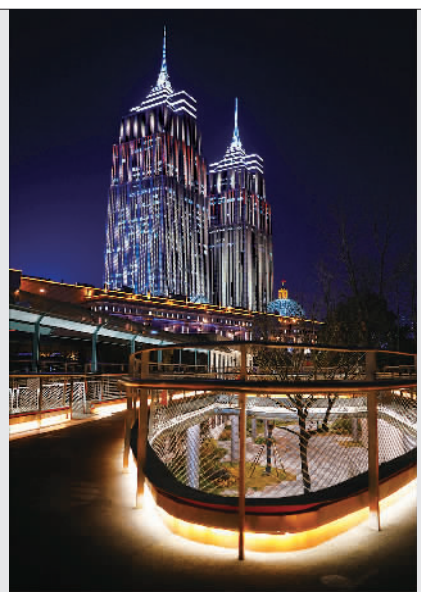
▲百禧公园一角的夜景

串联起中山北路与曹杨路南北两端的百禧公园,其前身和纽约高线公园相似,最初是真如货运铁路支线,铁路废弃后,这里又成了上海最长的综合市场。然而,彼时红火的市市场无法满足如今人们的生活需求。2019年市场被关停,长800多米、宽约