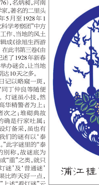
浦江桂花香(剪纸) 孙平

松江,历史上因盛产四鳃鲈鱼被誉为鲈乡。四鳃鲈鱼的学名为“松江鲈鱼”,以地方名字命名,这在鱼类名录中仅此一例。鱼米之乡,饭稻羹鱼,“松江鲈鱼”古今闻名遐迩,松江稻米也千年飘香。当年曹氏父子曾为松江在天下做了名副其实的鱼米之乡广告。