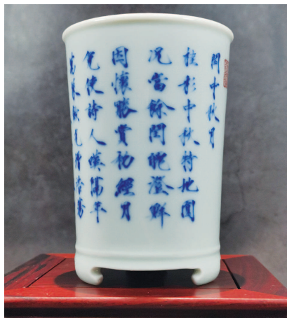
■ 青花笔筒上的《闰中秋月诗帖》

日月经天,叹时间飞逝;江河行地,思难忘岁月。收藏是一项辛勤的劳动,需要一种锲而不舍的精神。俗话说“天道酬勤”只要有恒心,坚持不懈地努力,一定会取得成功。收藏不仅是一种益智怡情的爱好,更是一门博大精深的学问,只要有心研究,认真体会,有睿智的慧眼和得当的收藏方式,就能收获收藏快乐和兴趣;但是,写作同样也是一种努力付出,需要一种持之以恒,守护传统。俗话说“不负春华,攀摘秋实”,经过原野的奋发努力,金秋新书如期与读者见面!可喜可贺,笔者也在此为他的热情与成功,点个大大的赞!