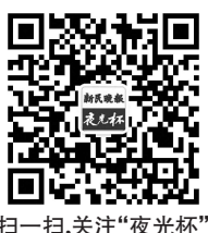
扫一扫,关注“夜光杯”