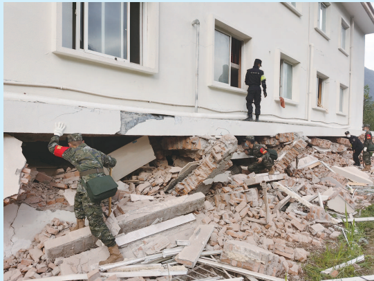
■ 昨天,武警四川总队甘孜支队官兵在磨西镇搜救被困群众