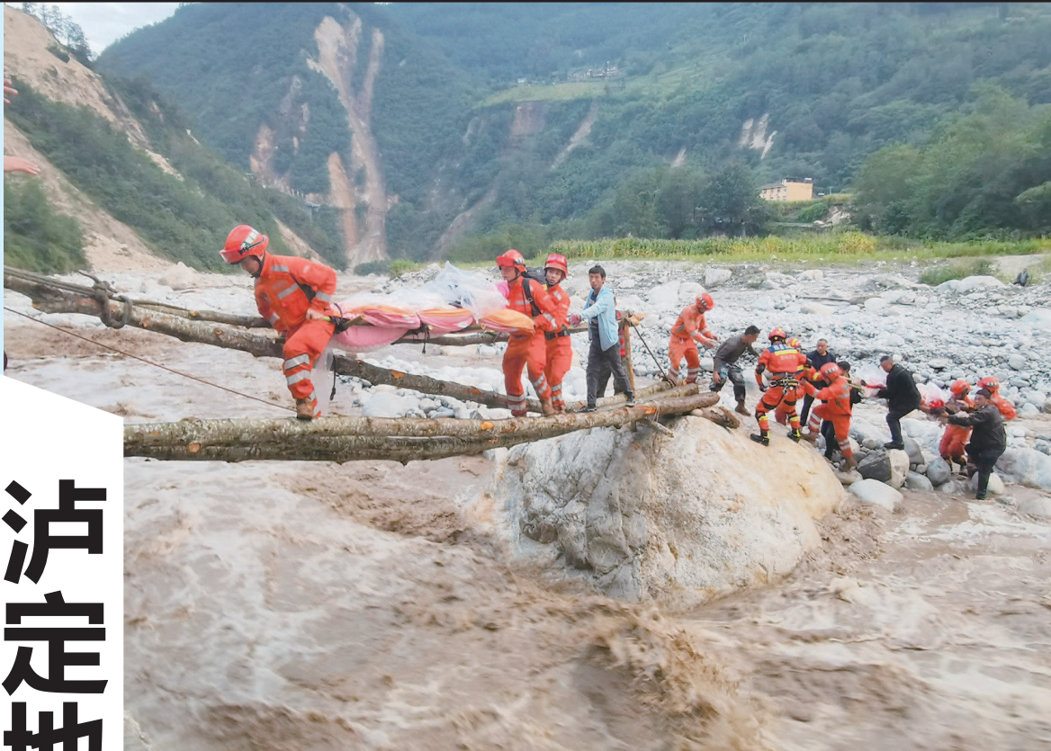
■ 昨天,武警四川总队机动第二支队官兵在磨西镇磨子沟村搭建临时木桥转移被困群众