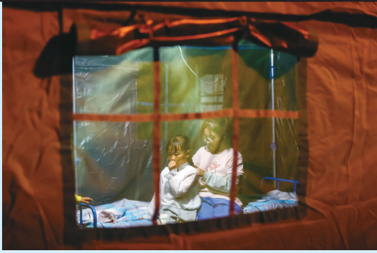
■ 昨晚,在四川甘孜州泸定县磨西镇受灾群众临时安置点,两名小女孩在帐篷里