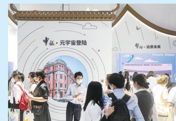
元宇宙应用场景体验,吸引不少市民前来