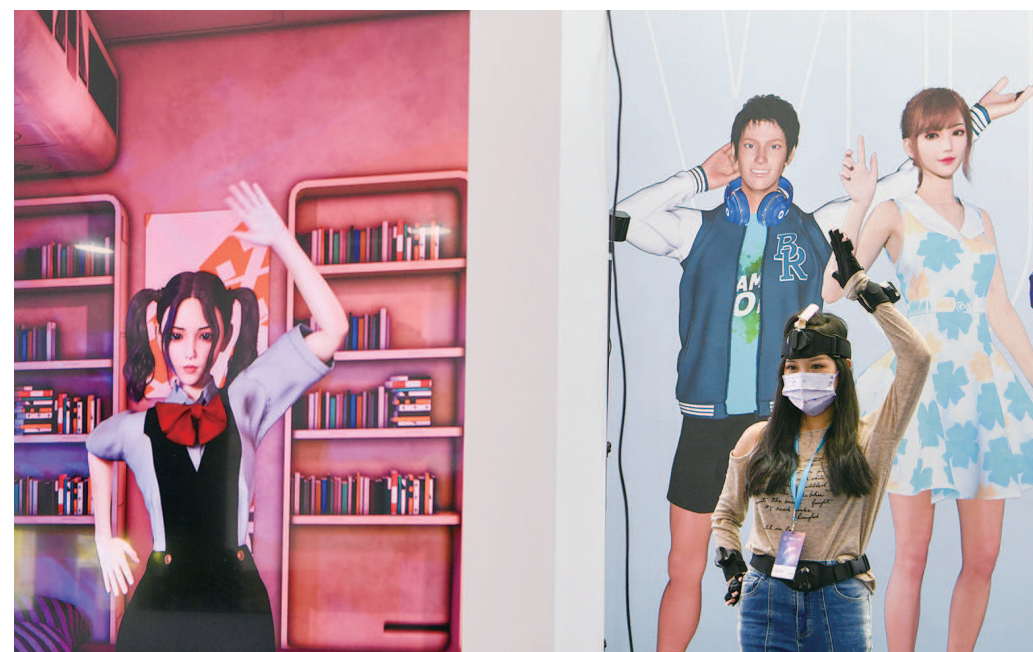
随着交互技术的发展,虚拟主播的延迟度不断降低

这款AR眼镜通过高精度的虚实叠加、三维建模、多人协同、地图共享、3D空间实时标注以及25关节手势识别等AR基础功能,让现场观众通过佩戴眼镜进行实时手势交互,体验在虚拟空间里通过精准的三维手势操作与空间锚定实现协同作业