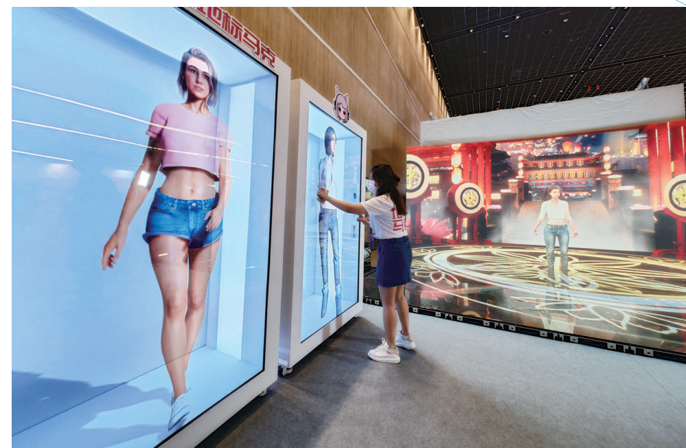
可换装的元宇宙AR数字人可用于购物中心数字橱窗展示等场景