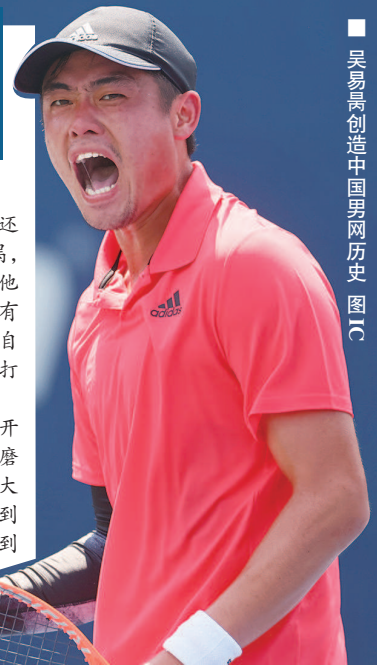
吴易昺创造中国男网历史