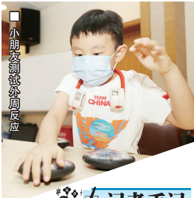
小朋友测试外周反应