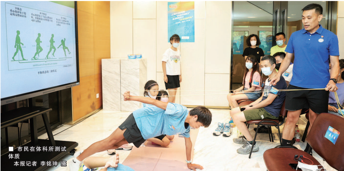
市民在体科所测试体质

家对话答疑解惑等活动,一同探索体育科技的魅力。上海体科所的专家还透露了奥运冠军钟天使在东京奥运会成功夺冠背后的小秘密。