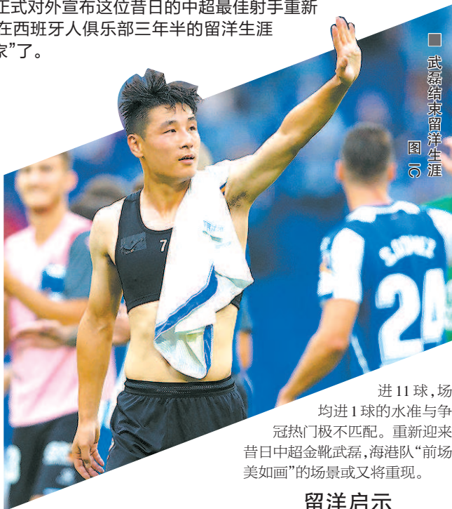
武磊结束留洋生涯

欢迎你,武磊!昨天下午,上海海港俱乐部在官方微博上发布海报:欢迎武磊回家,正式对外宣布这位昔日的中超最佳射手重新回归球队。结束了在西班牙人俱乐部三年半的留洋生涯后,武磊终于回“娘家”了。