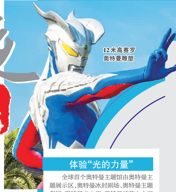
12米高赛罗奥特曼雕塑

新民夜上海 越夜越精彩 八小时之外，大好休闲时光，兜兜逛逛、看戏听歌、运动健身、血拼美食。引领时尚，廓清风气，更多精彩，尽在新民夜上海！ 视觉设计黄娟 本版编辑刘珍华