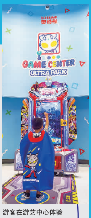
游客在游艺中心体验

奥特曼游艺中心集奥特曼系列游戏项目与收藏于一体，引进了全新体感主题游乐设备，逼真体感激发玩家运动细胞，带来富有冲击的娱乐体验；更有琳琅满目的扭蛋机器，汇集近百款正版授权周边。