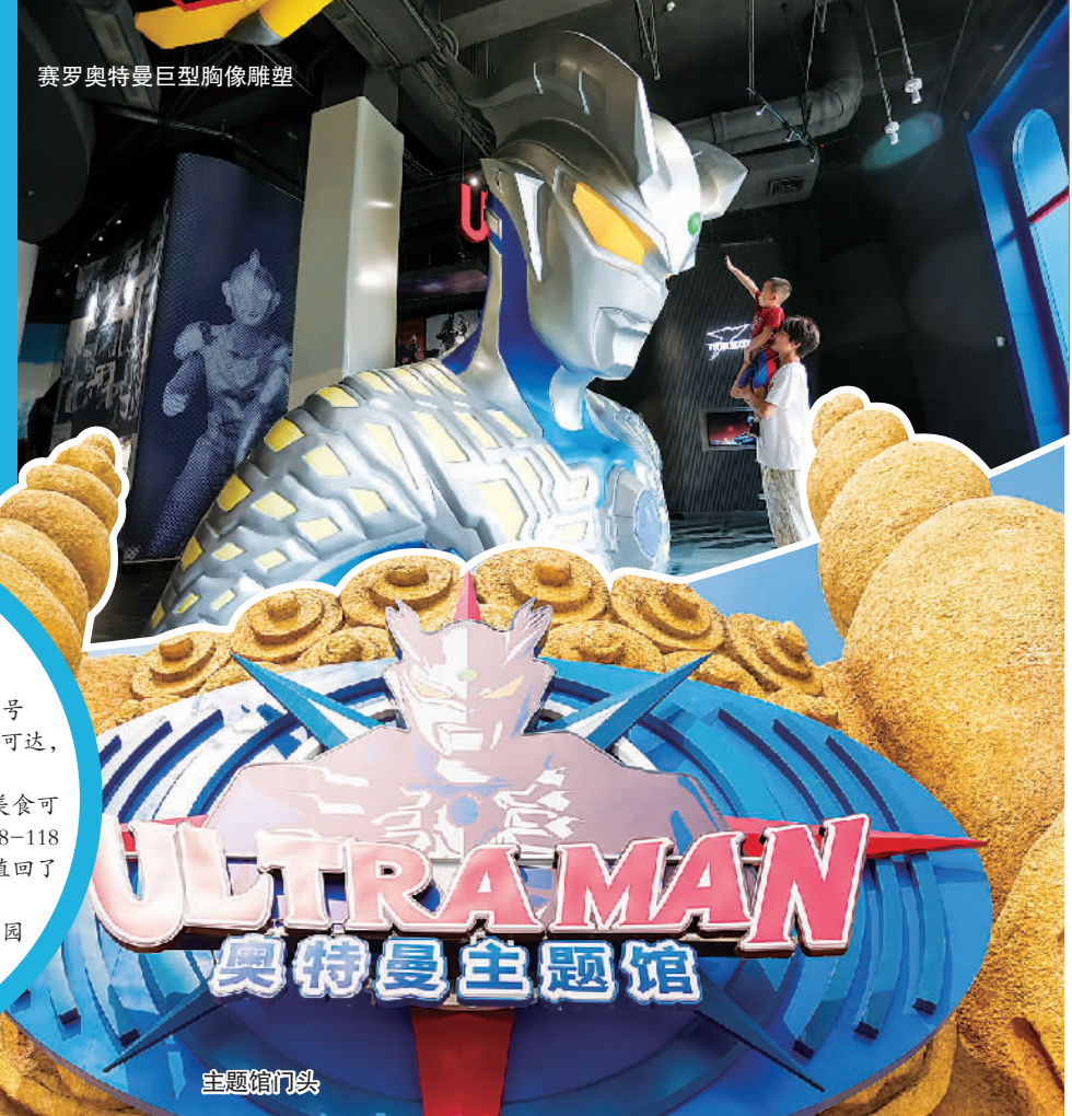
赛罗奥特曼巨型胸像雕塑