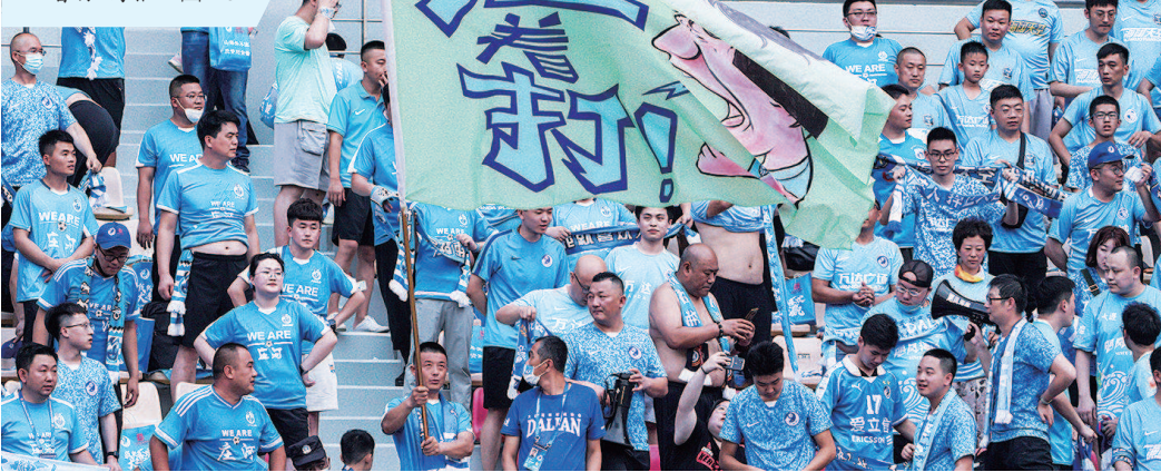
■ 大连球迷在赛场展示“压着打”海报

“就要压着打!”看台上的大连球迷,特意在球场内展示了这样一幅巨型海报。征服了大连球迷的谢晖,接下来还会带来什么样的惊喜呢? 本报记者 关尹