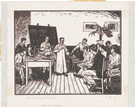
■ 李桦《鲁迅先生在木刻讲习会》