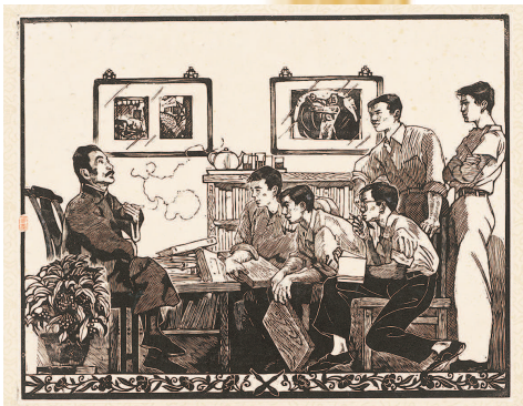
■ 黄永玉《鲁迅和木刻青年》