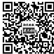
扫一扫,关注“夜光杯”

至是同化。这便是为什么中国的许多话剧，还有不少原创的、翻案的戏曲如潘金莲、阎婆惜、崔氏，专注于善恶的翻覆，不在意善良的层次，似乎只在一个“好”字上做文章，便不是完整、全面和深刻的了。