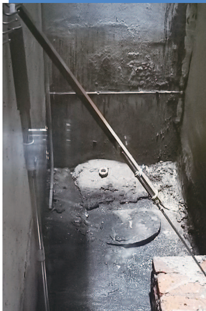
■ 天井里的粪坑满溢数月，臭气熏天，居民苦不堪言

昨天，新民晚报夏令热线接到一条“臭气熏天”的投诉：家住耀华路550弄的居民王先生反映，自家底楼天井里的窨井粪便满溢，臭气熏到头晕眼睛疼，盛夏时节不敢开窗通风。更让他无奈的是，自3月起，居民向物业报修多次，但问题至今没有得到解决。“堵点”究竟在哪里呢？