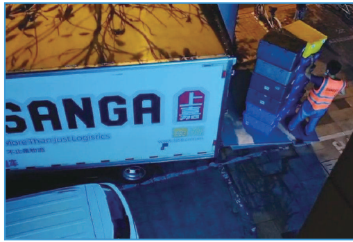
■ 工人凌晨卸货时发出巨大声响