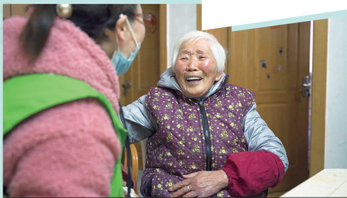
■ 喜欢听沪剧的老妈妈笑了