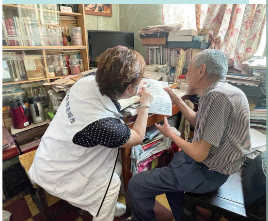
■ 工作人员上门探望沈老伯