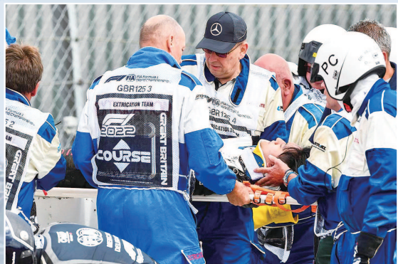
▲ 周冠宇被送往赛道医疗中心