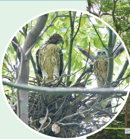
▲ 凤头鹰宝宝 ▶ 公园拉起了绿网

专家认为,在抗击疫情的两个月内,上海的“野生动物居民们”生活得更轻松惬意,活动范围也更广了。而如今恢复正常生产生活秩序后,人与动物都需重新适应“和谐”的相处模式。