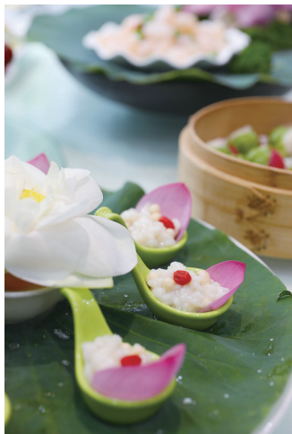
■ 莲花鱼米羹

结合的,当属“莲藕三色小笼”。小笼皮包含红、绿、白三色,红色面坯中加入了火龙果汁,绿色面坯中加入了菠菜汁,肉馅里加入了清脆爽口的藕粒,一枚入肚,暑气消散了。