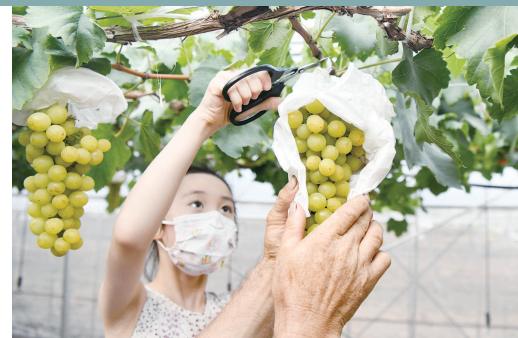
■ 市民采摘葡萄

记者获悉,餐厅二楼现已重新翻新,新增多个包房,用餐环境更舒适。由于荷花荷叶等原材料都须当天新鲜采摘,因此要品尝“荷花宴”,需至少提前一天拨打59124233电话预订。 本报记者 金旻矣