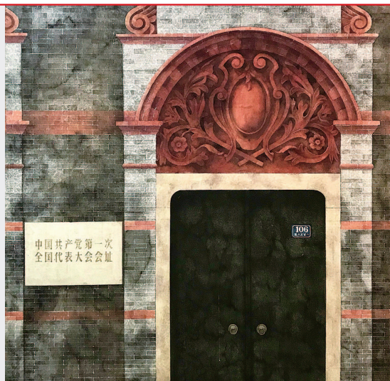
洪健《中共一大纪念馆》